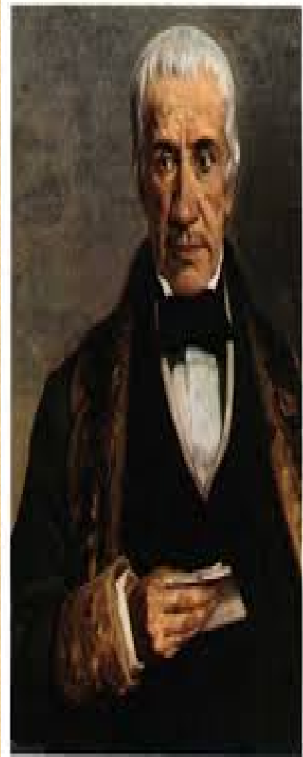
Γεώργιος Ριζάριος, Ευεργέτης και ιδρυτής, μαζί με τον αδελφό του Μάνθο Ριζάρη, της Ριζαρείου Σχολής. Ελαιογραφία του Νικήφ. Λύτρα (Αθήνα, Ριζάρειος Εκκλησιαστική Σχολή).